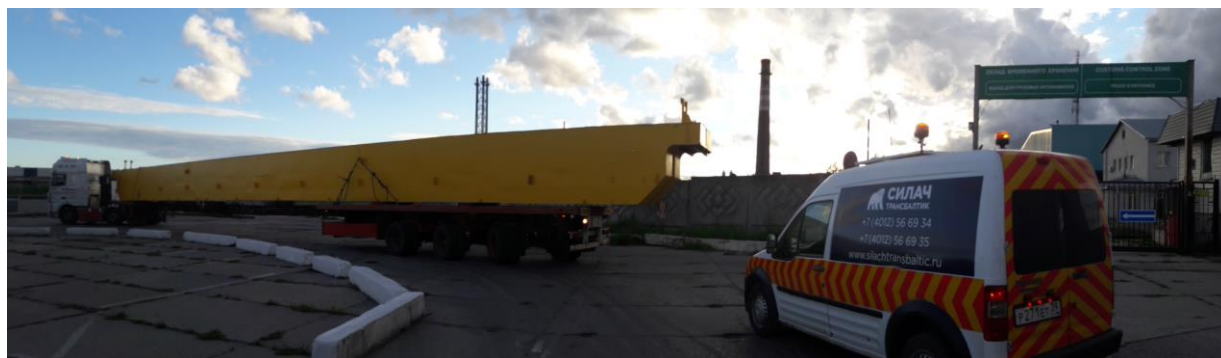
Пролётные балки мостового крана (33*2*2м)