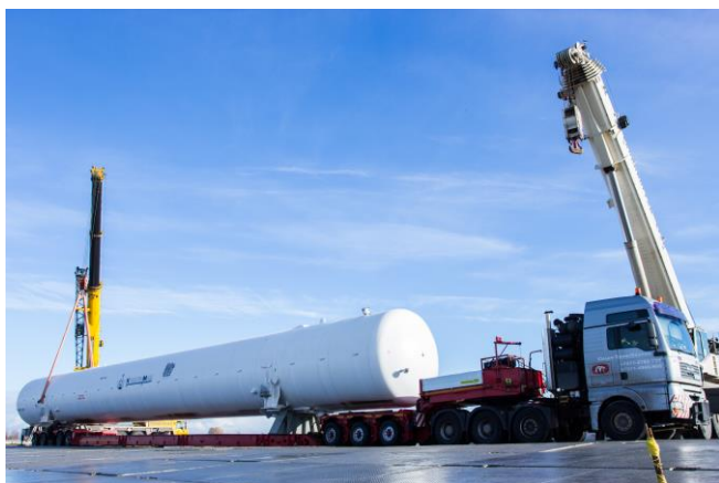
Ёмкость для сж. Газа (36,5*3,8*4,2 м, 80 000кг)

Предлагаем Вашему вниманию некоторые примеры работы Силачей: