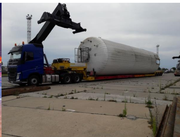
Ёмкости брожения (24*4,2*4,2м)