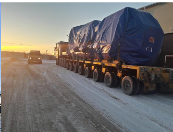
Дизель-генераторы (БАЭС) 88 000кг