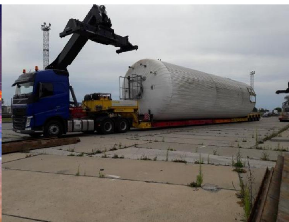
Ёмкости брожения (24*4,2*4,2м)